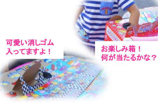
可愛い消しゴム入ってますよ！