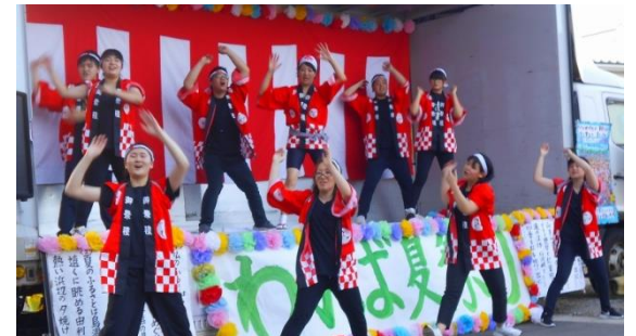
新入社員！頑張って踊りました！