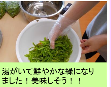
湯がいて鮮やかな緑になりました！美味しそう！！