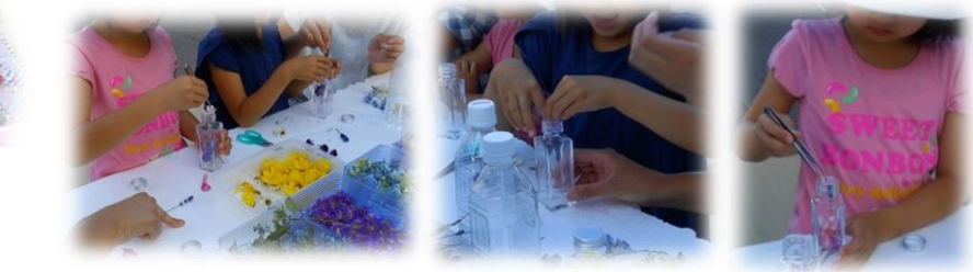
ハーバリウム体験コーナー！好きな花を選び、瓶に詰めます。次にハーバリウムオイルを瓶に伝わせるように流しを入れて出来上がりです！