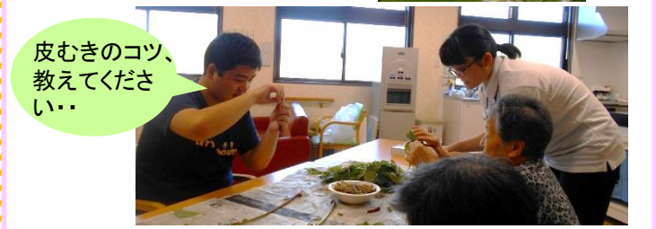
皮むきのコツ、教えてください...