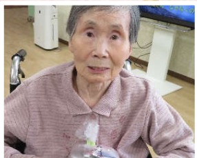
ハズレもまた一興…