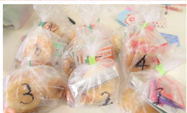
お茶漬の素や納豆も…！