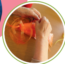
物作りで 手指の運動